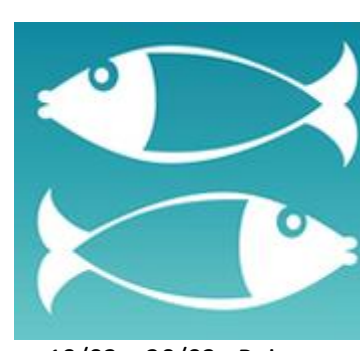
19/02 – 20/03 : Poissons

1. Choisis dans la liste suivante les noms latins des signes astrologiques.