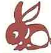
1999/2011/2023 : Chat ou Lièvre