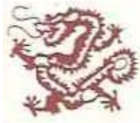
2000/2012/2024 : Dragon