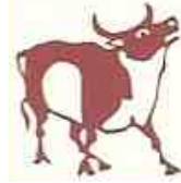
1997/2009/2021 : Βοεuf