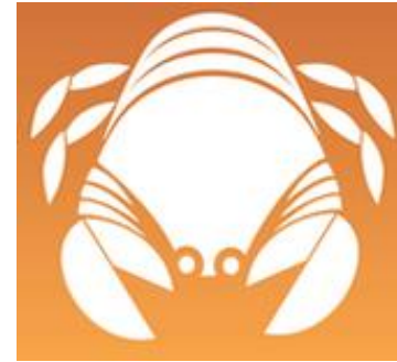
22/06 – 22/07 : Cancer