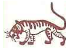
1998/2010/2022 : Tigre