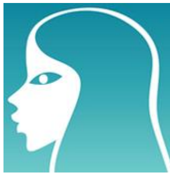
23/08 – 22/09 : Vierge