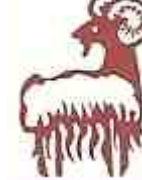
2003/2015/2027 : Chèvre