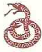
2001/2013/2025 : Serpent