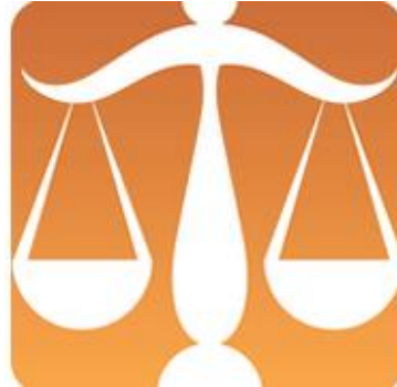
23/09 – 20/10 : Balance