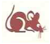
1996/2008/2020 : Rat