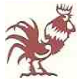
2005/2017/2029 : Coq